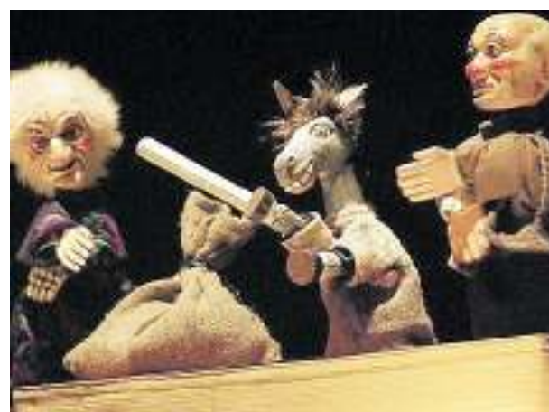
"Le Avventure di Mengone Torcicolli"

Per bimbi Quattro show al Ridotto delle Muse e repliche al Salesi. Si parte oggi