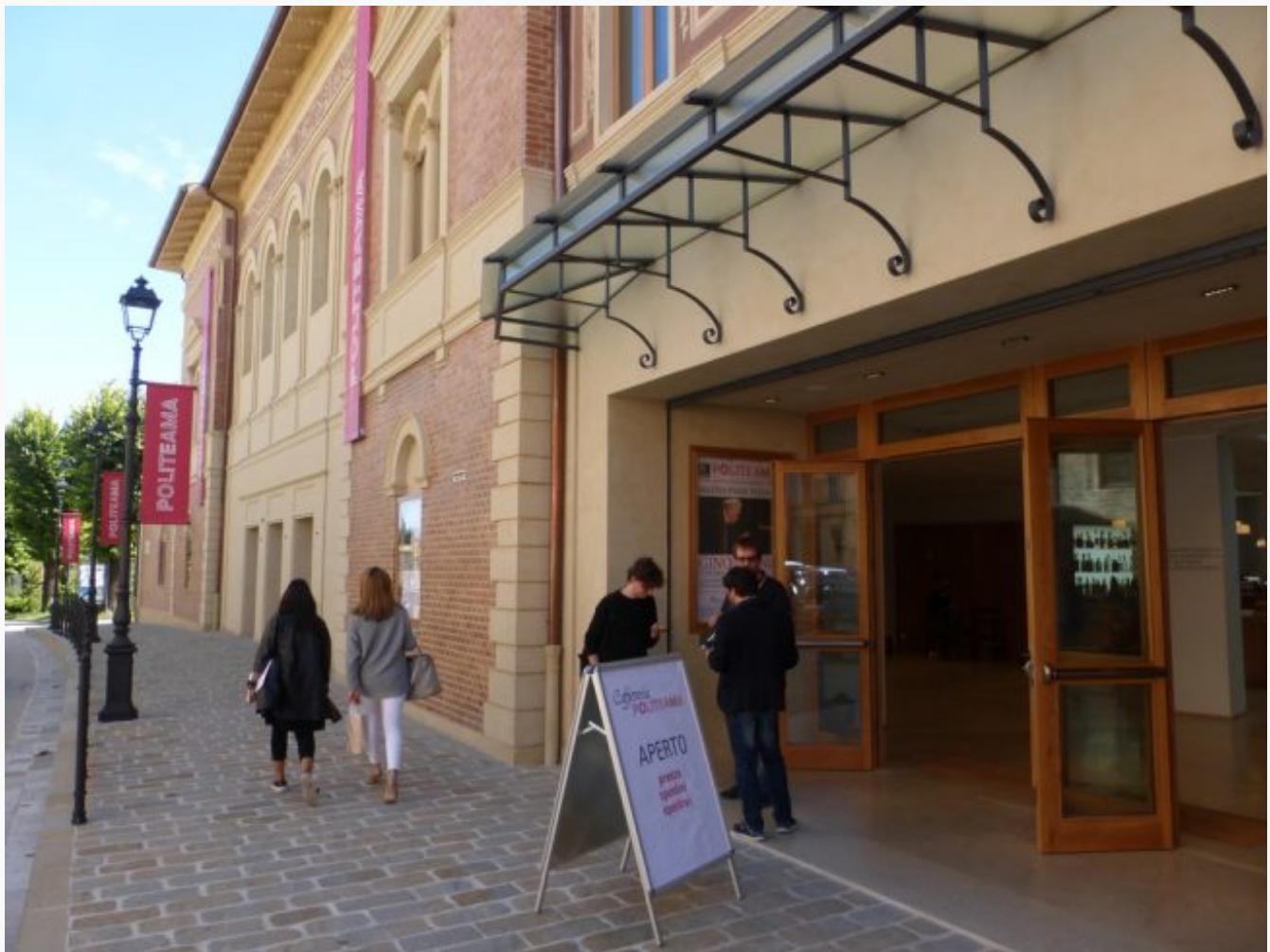
L'ingresso del Politeama di Tolentino

TOLENTINO - La struttura è pronta a debuttare con la prima stagione dopo la rinascita, 5 i festival tematici: piano, jazz, teatro, cabaret e altri percorsi in musica. Mercoledì e venerdì il grande schermo offrirà spettacoli alternativi ai multisala. Il sindaco Pezzanesi: "Adoro Franco Moschini, senza di lui la storia della città non sarebbe la stessa"