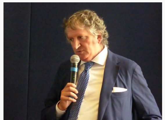
Il sindaco di Tolentino Giuseppe Pezzanesi

Una parola anche per il teatro Vaccaj: «Quando riavremo il nostro teatro ci saranno moltissime cose da vivere – conclude il sindaco – l'importante è non sovrapporsi e avere l'attenzione di differenziare gli eventi. Ora stiamo lavorando agli affreschi e ci sono alcune complicazioni, speriamo di poter mantenere la promessa di riaprire entro l'estate 2018». La stagione sarà inaugurata dal concerto di Gino Brandi che dopo 80 anni di illustre carriera torna nel luogo dove aveva debuttato a soli 7 anni. «E' una piacevole coincidenza – spiega Cinzia Pennesi maestro di piano e curatrice della rassegna Master Piano – Il 22 settembre 1937 Brandi fece il suo primo concerto al Politeama oggi ritorna ad inaugurarlo. La rassegna di piano prevede anche delle master class in cui gli artisti diventano insegnanti nonché giurati per un futuro premio pianistico».